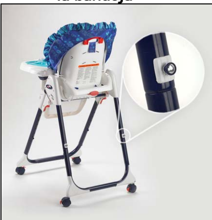
Silla Alta Healthy Care™ con clavija para guardar la bandeja