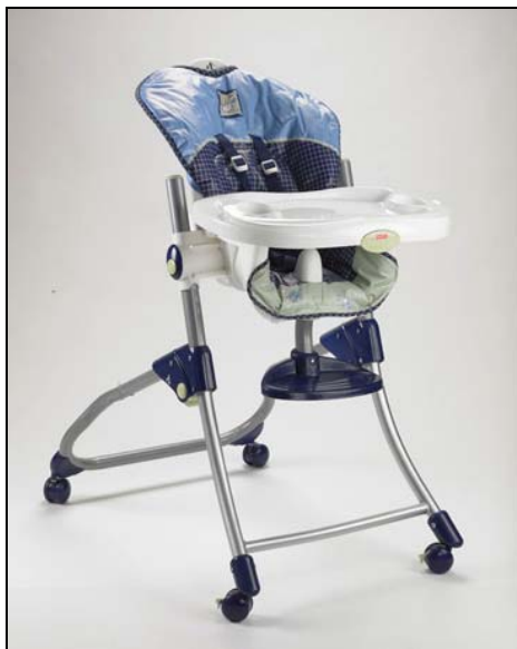
F-P Trona Cerca de Mi